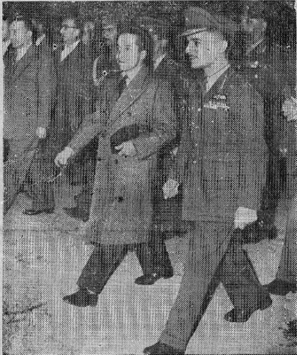
El Rey Faisal II de Iraq (izquierda) y su primo el Rey Hussein de Jordania, aparecen en Amman donde Faisal fue para unir su país con Jordania en una nueva Federación Árabe. El Rey Faisal será el Jefe de la Federación, pero el Rey Hussein conservará su título. Tendrán ejército unificado, al igual que política exterior, cuerpo diplomático y una legislatura conjunta